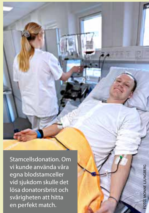
Stamcellsdonation. Om vi kunde använda våra egna blodstamceller vid sjukdom skulle det lösa donatorsbrist och svårigheten att hitta en perfekt match.

Genom att transplantera blodstamceller från unga möss till äldre lycka-